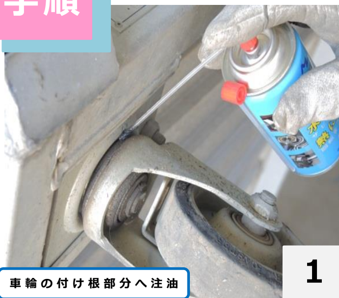
車輪の付け根部分へ注油