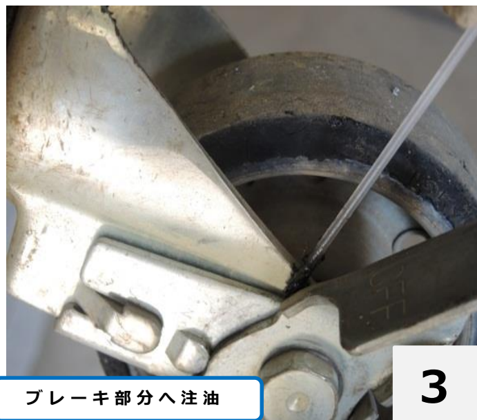
ブレーキ部分へ注油