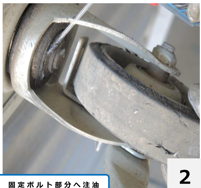
固定ボルト部分へ注油