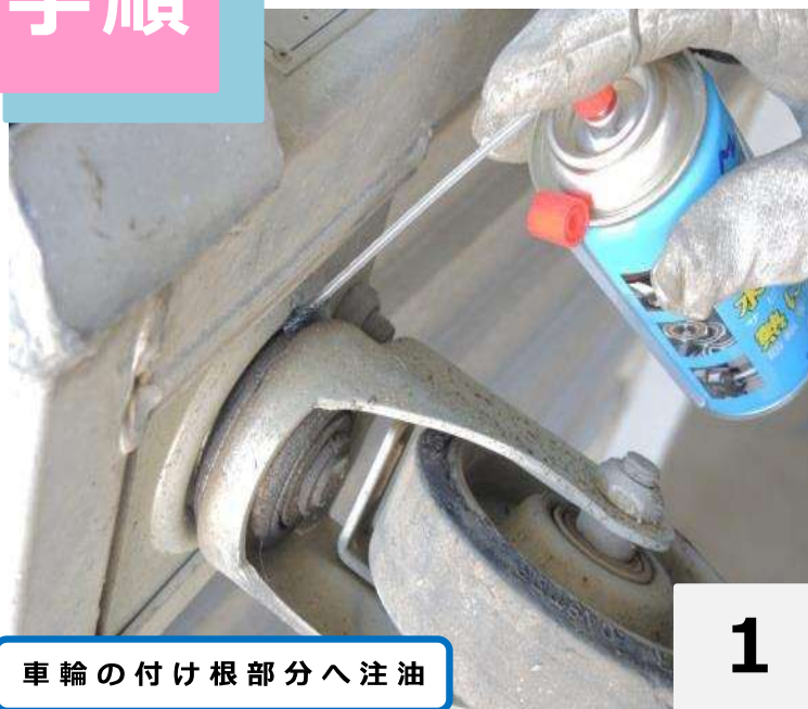
車輪の付け根部分へ注油