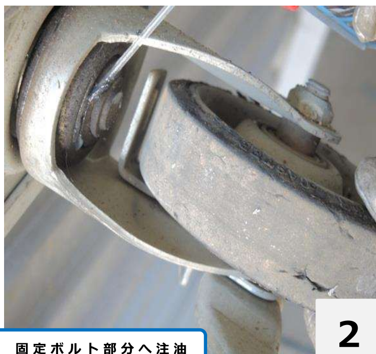
固定ボルト部分へ注油