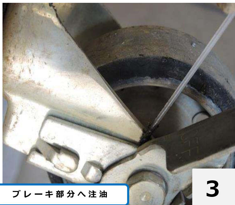
ブレーキ部分へ注油